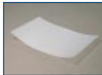
従来クロスのカール The curl of Conventional fabrics.

1plied 100 \mu m fabrics in resin laminete(Tg150 ^{\circ} C) with special treatment