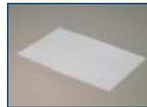
AZクロスのカール The curl of AZ-Fabrics.