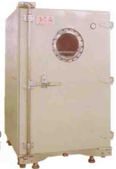
DC-6040 DC-8060 除濕防潮箱 DRYING CHAMBER