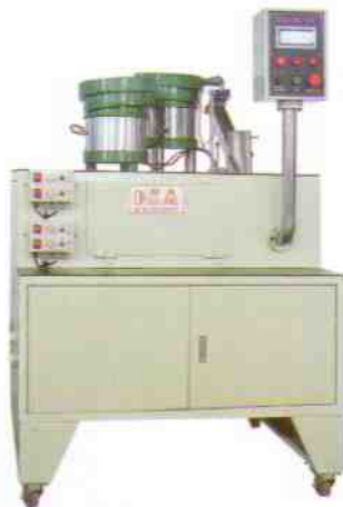
MOD.AF-20 全自動計量充填包裝機