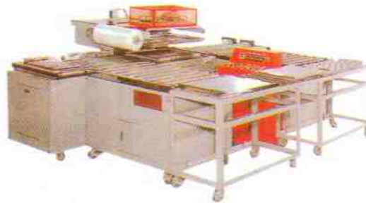
全自動 SPH-5580DA 6080DA