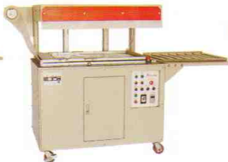
自動 SP-5580D 7090D SP-4055