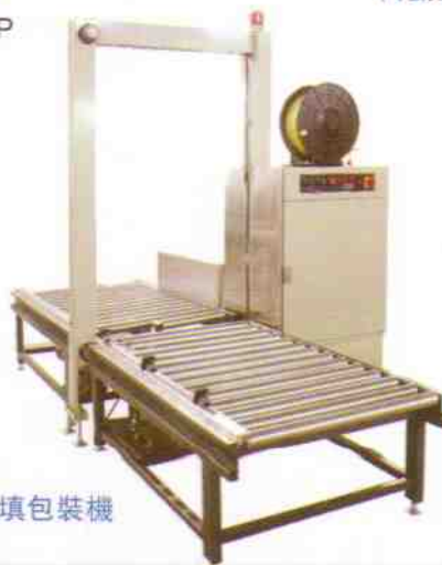
MOD.AS-1016A 全自動捆包機 (附滾筒自動進料) AUTOMATIC STRAPPING MACHINE (OPTIONAL: ROLLER CONVEYOR)