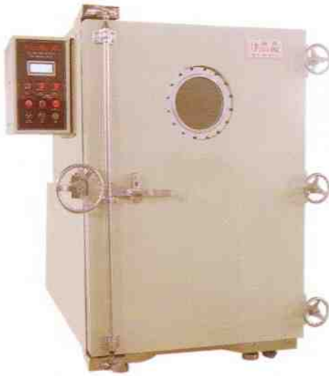
VD-6040 VD-8060 真空乾燥箱 VACUUM DRYING CHAMBER