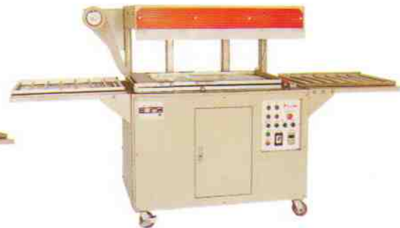
自動 SP-5580DL 7090DL 可左進右出及右進右出 WITH LEFT & RIGHT SIDE INFEED CONVEYOR