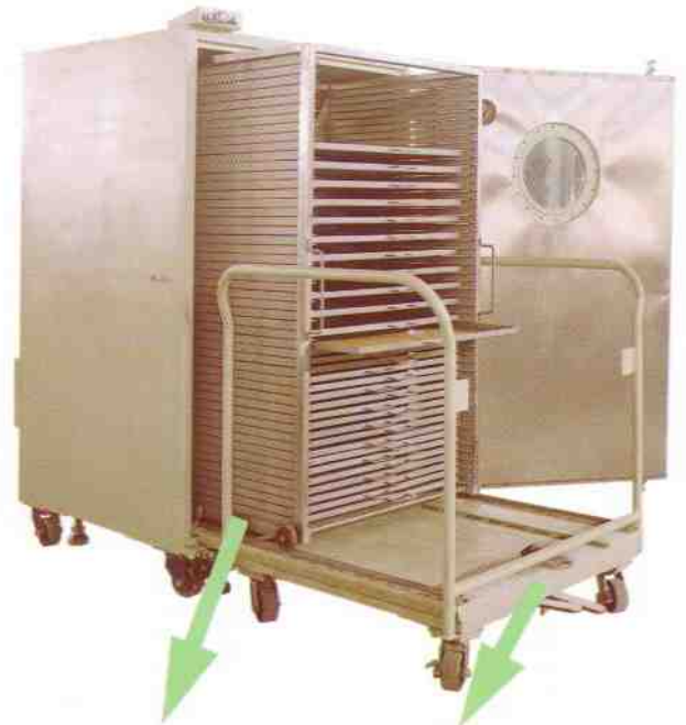
RK-6040 RK-8060 儲料架RACK